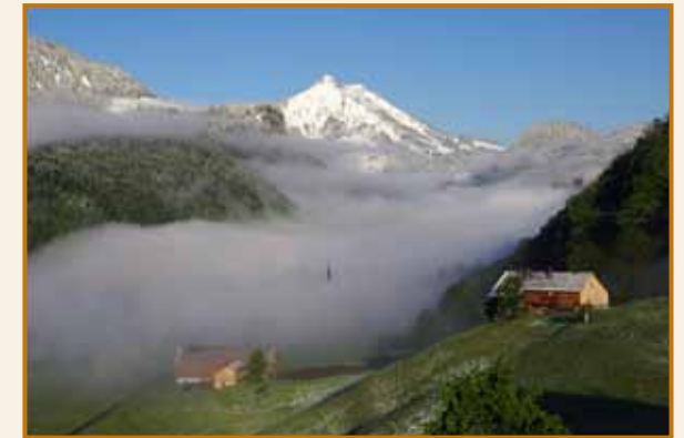
Huguette STEINSULTZ Buschwiller