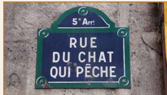
Alain ALLARD Neuwiller