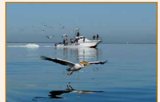
Jocelyne HUTTENSCHMIDT Buschwiller