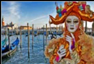
Titre : Venise Auteur : Edouard Finn