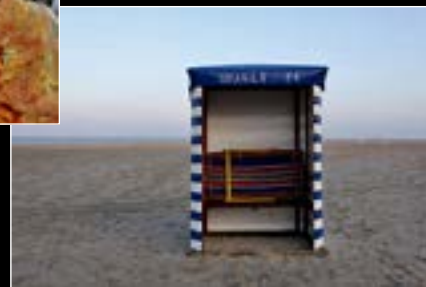
Titre : Strandkorb auf Borkum Auteur : Gottfried Wiedemann