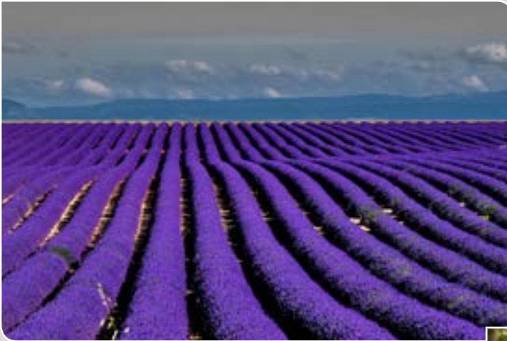
Bachmann Patrice Ruederbach Lavande