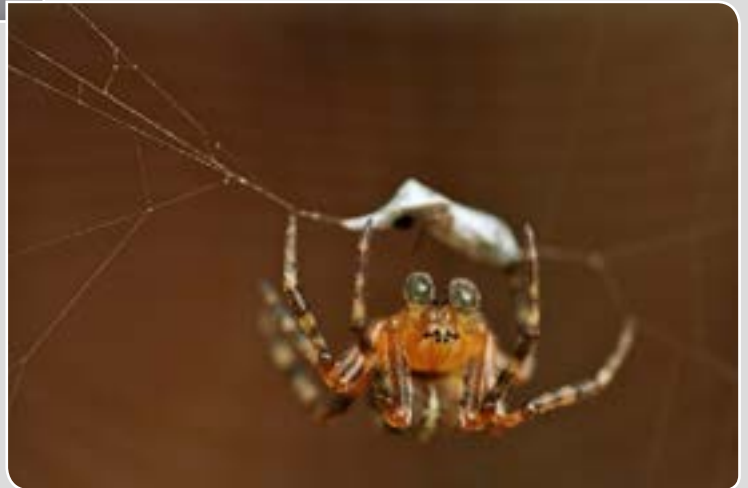
Jacky NAESSENS Uffheim Aranéides