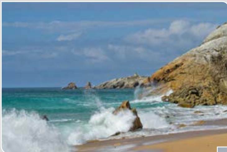
Valérie NAESSENS Uffheim Terres Celtiques