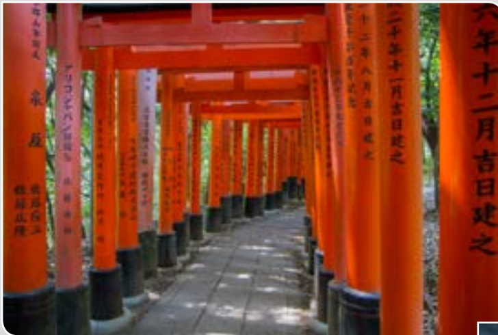
Béatrice TRENZ Saint-Louis Japon graphique