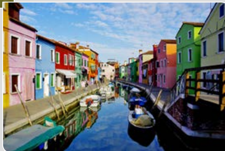
Huguette STEINSULTZ Buschwiller