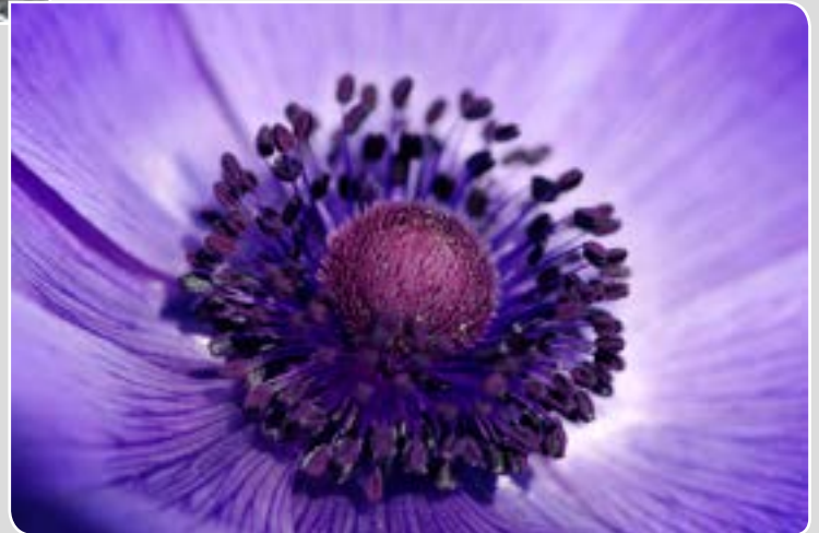
Philippe MEISBURGER Village-Neuf Le pouvoir des fleurs