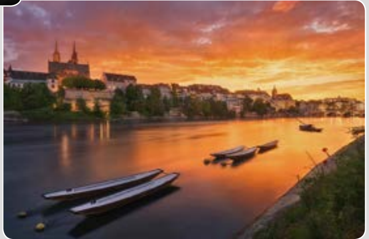
Thibault FROEHLI Village-Neuf Visions bâloises