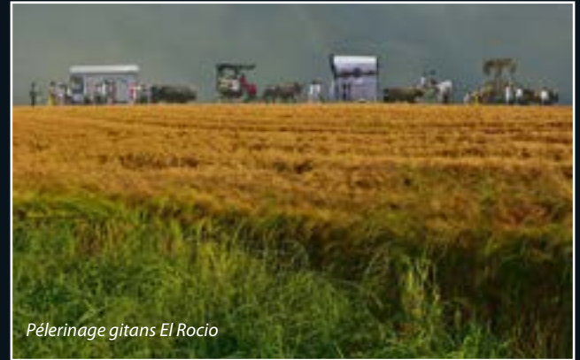
Pèlerinage gitans El Rocío