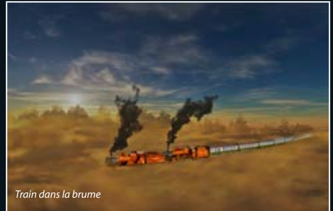
Train dans la brume