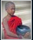
Quête du moinillon